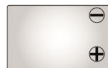
Тип клемм F2